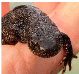
Bild: Geretteter Kammmolch

Auch dieses Jahr installiert der Arbeitskreis Klimaschutz/Bund Naturschutz an den asphaltierten Wegen um die Kläranlage Tauberfeld Richtung Möckenlohe und Wolkertshofen wieder einen Amphibienschutzzaun. Hier wandern im Frühjahr Amphibien wie Erdkröten und Molche (Teich- und Bergmolch, aber auch der streng geschützte und vom Aussterben bedrohte Kammmolch) von ihren Überwinterungsquartieren unter Stein- und Heckenstrukturen an der Bahnlinie Richtung Überlaufbecken der Kläranlage. Bitte fahren Sie in den Abend-, Nacht- und Frühstunden hier besonders langsam und vorsichtig (schnelleres Fahren als 30 km/h lässt das Trommelfell der Tiere platzen). Die Gemeinde hat dazu entsprechende Hinweisschilder aufgestellt. Falls Sie ein Tier entdecken, gerne anhalten und in Richtung Kläranlage tragen. Wer Interesse hat, aktiv beim Umsetzen der Tiere über die Straßen mitzuhelfen, kann sich unter superhummeln@gmail.com melden. Wir freuen uns über jede/n Helferin und Helfer.